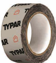
TYPAR® CINTA DE CONSTRUCCION Rollo de 4.76 cm x 50.3 ml