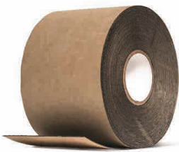
TYPAR® CINTA FLEXIBLE Rollo de 15.24 cm x 22.8 ml

La cinta para construcción Typar® permite pegar rápidamente los solapes de las barreras con iguales condiciones de resistencia a los rayos UV y climas extremos que las propias barreras.