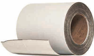
TYPAR® CINTA REGULAR Rollo de 15.24 cm x 22.8 ml